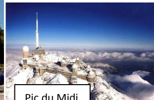
Pic du Midi

Im Winter herrscht eher der Wintersport.